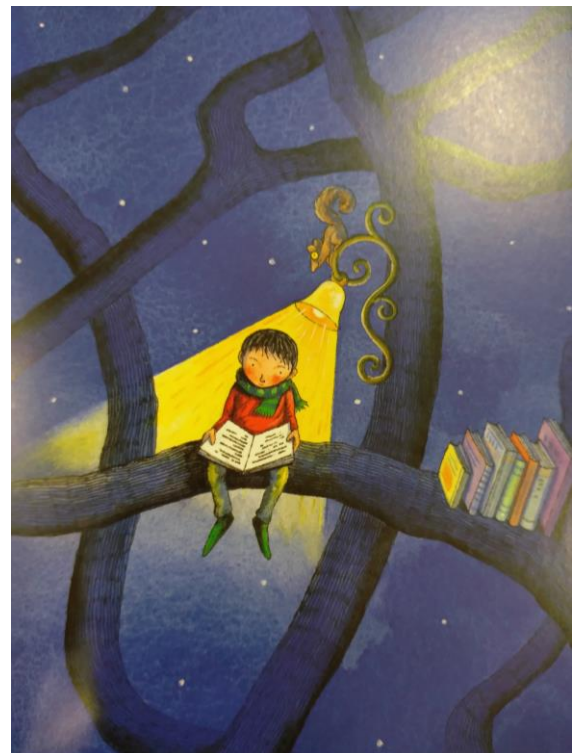
Immagine di Jimmy Liao

Proposte di lettura della Biblioteca comunale di Monfalcone – Sezione Ragazzi per tutti i ragazzi che vogliono trascorrere le vacanze in compagnia di un buon libro.